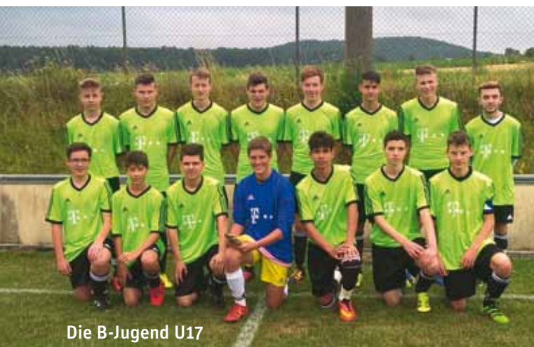
Die B-Jugend U17

Ich wünsche euch alles Gute, und hoffe auf ein baldiges Wiedersehen.