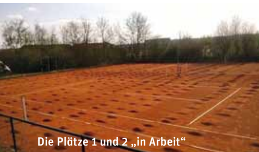
Die Plätze 1 und 2 „in Arbeit“

Die jährlichen Arbeiten für die Frühjahrsinstandsetzung der Tennisplätze wurden im April 2017 erstmals professionell von einer Firma erledigt, wobei wir bei einigen Tätigkeiten Hand anlegen konnten. Das Wetter war in den Tagen darauf gut und die Plätze konnten daher nach dem Aufhängen der Netze bald bespielt werden.