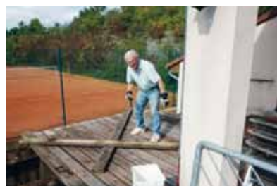
Demontage der Terrasse

Zum Abschluss der Saison 2017 haben wir uns dem Abbau der leider sehr maroden Holzkonstruktion gewidmet und wollen alles bis Ende November erledigt haben. Bis zum Beginn der Saison 2018 soll die Terrasse wieder neu aufgebaut sein, wobei einzelne Arbeiten, soweit es möglich ist, von der Abteilung eingebracht werden.