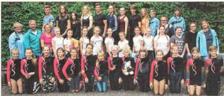
Die drei Mannschaften und zwei Einzelkämpfer des TSV Scheinfeld hatten nach ihrem Erfolg in Roth allen Grund zum Strahlen.

Seit dem Wettkampfe wird bereits für den nächsten Vergleich Ende Juli trainiert, der die Turnerinnen und Turner dann in die Oberpfalz führen wird.