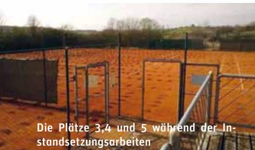
Die Plätze 3,4 und 5 während der Instandsetzungsarbeiten

Leider hatte die Abteilung auch in diesem Sommer nur zwei Mannschaften melden können: