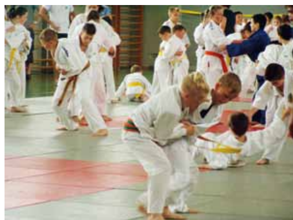
Bezirkslehrgang 40 Jahre Judo Scheinfeld