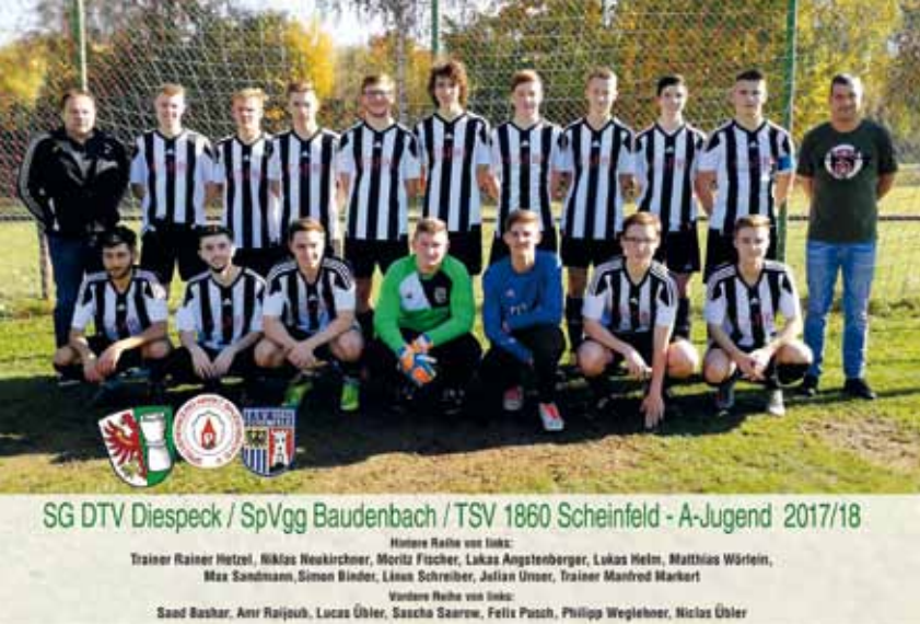
SG DTV Diespeck / SpVgg Baudenbach / TSV 1860 Scheinfeld - A-Jugend 2017/18