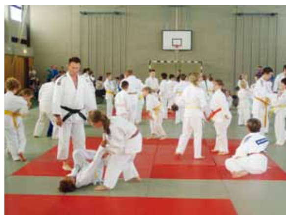
Bezirkslehrgang 40 Jahre Judo Scheinfeld